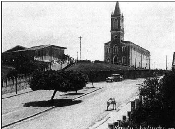
Colina de Santo Antonio do Aracaju

“Chamaram a nova fundação, situada imediatamente acima da embocadura do rio, Aracaju. Tem aspecto sumamente agradável. Tudo é bonito e novo na margem, embora muito provisório. A residência do Presidente, a Câmara Provincial dos Deputados, um Quartel, uma Igreja e até uma Loja Maçônica – tudo ostenta na sua pequenez e exiguidade de espaço primorosa e bonita aparência”.