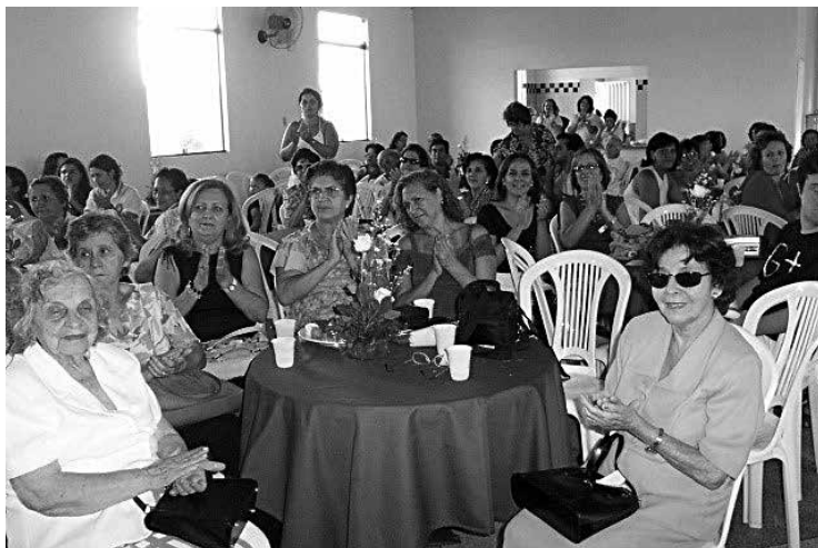
TARDE FESTIVA COM A APAE/SE