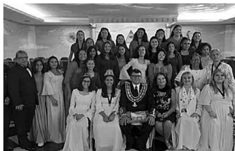
GRUPO ARCO IRIS