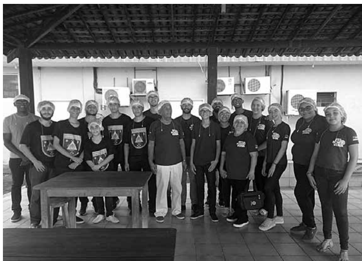
APEJOTISTAS EM ATIVIDADE