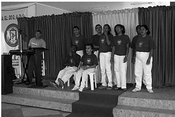
TARDE FESTIVA COM A APAE/SE