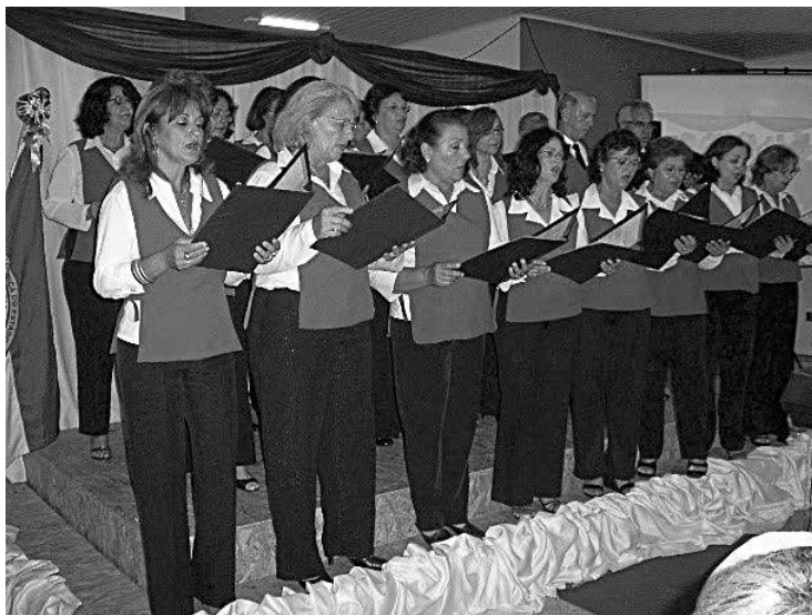
CORAL CANTO FRATERNO