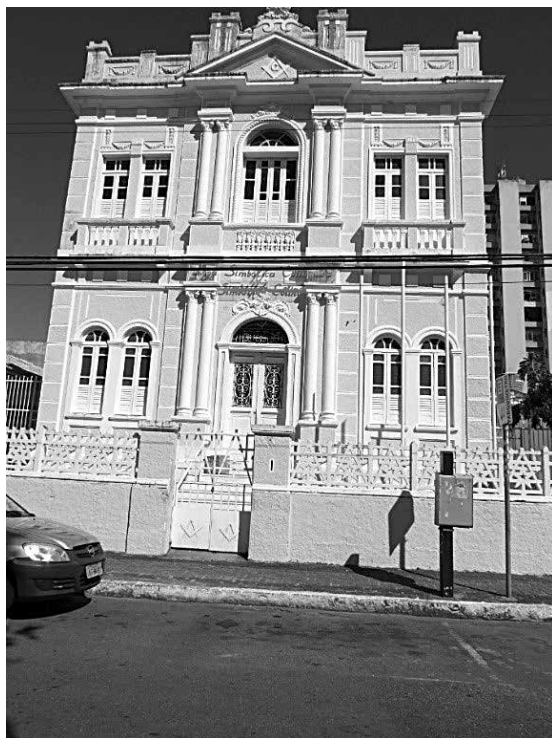
Loja Capitular Cotinguiba -Aracaju.

Com exceção da Loja Cotinguiba que funciona maravilhosamente bem até os dias atuais, as demais Oficinas citadas, tiveram vida maçônica muito curta, isto é, não chegaram a se constituir como entidades regulares, desse modo podemos afirmar com toda segurança, que a maçonaria em Sergipe se consolidou com o funcionamento da Loja Cotinguiba, presente de forma ativa e propositiva em todos os movimentos sociais de Sergipe e de Aracaju em particular, o que lhe dá ainda hoje, o status de Entidade que trabalha em prol do desenvolvimento do nosso Estado.