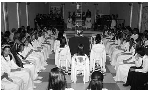
FILHAS DE JÓ