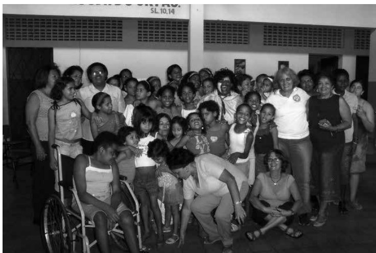
TARDE RECREATIVA COM ASSISTIDOS DO LAR SANTA ZITA/ARACAJU