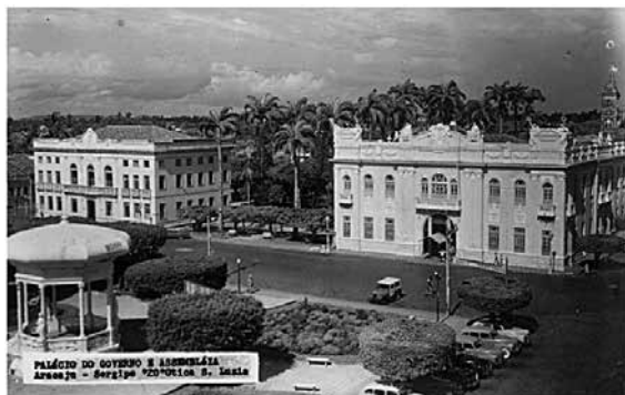
Câmara Provincial e Residência do Presidente