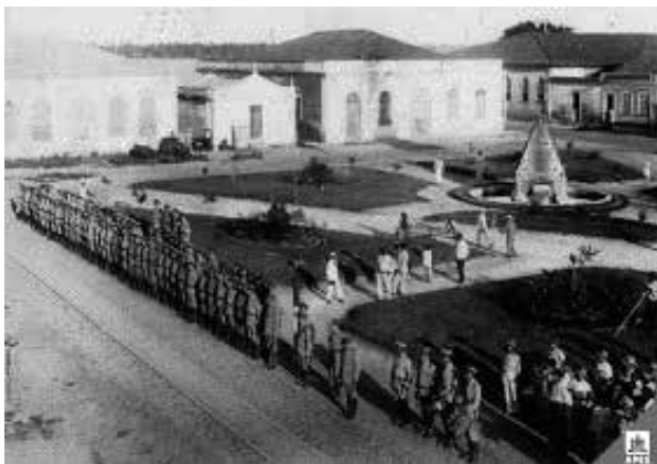
Praça da cadeia – foto de 1856