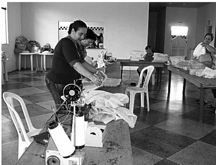
CURSOS OFERECIDOS PELA FRATERNIDADE