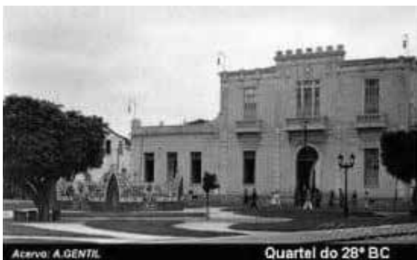
Quartel do 28º BC

A partir dos anos 50 do Séc. XIX, já existiam várias Lojas Maçônicas funcionando no estado de Sergipe: