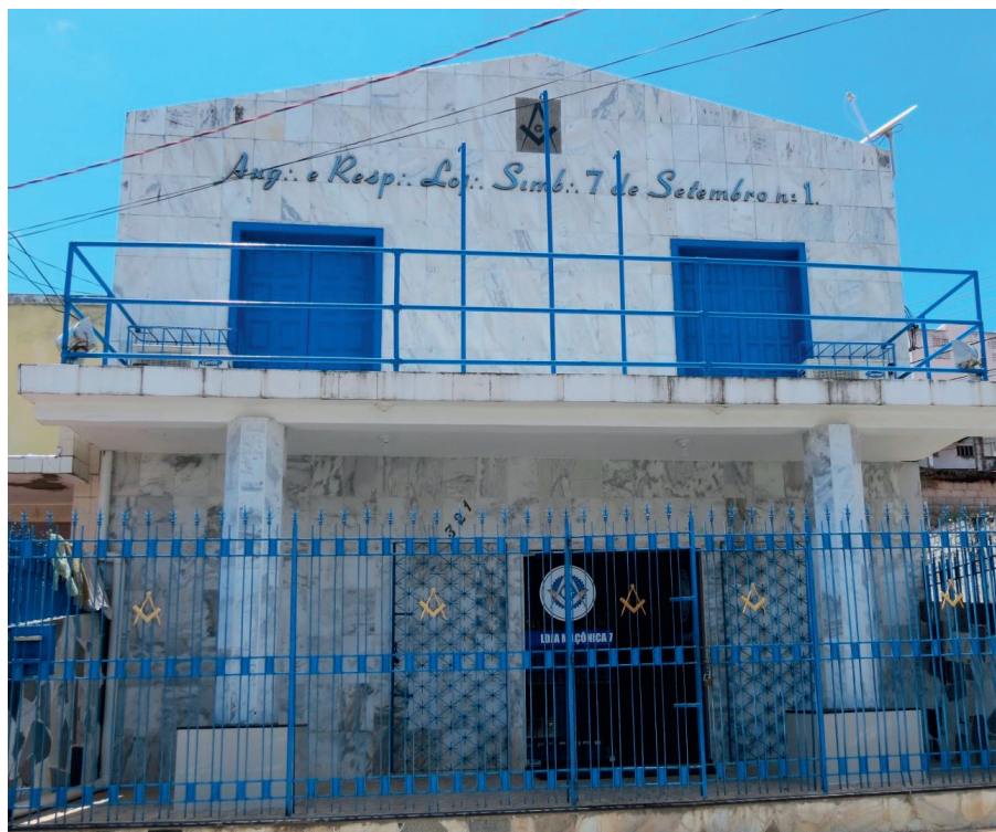
Sede atual da Loja 7 de Setembro