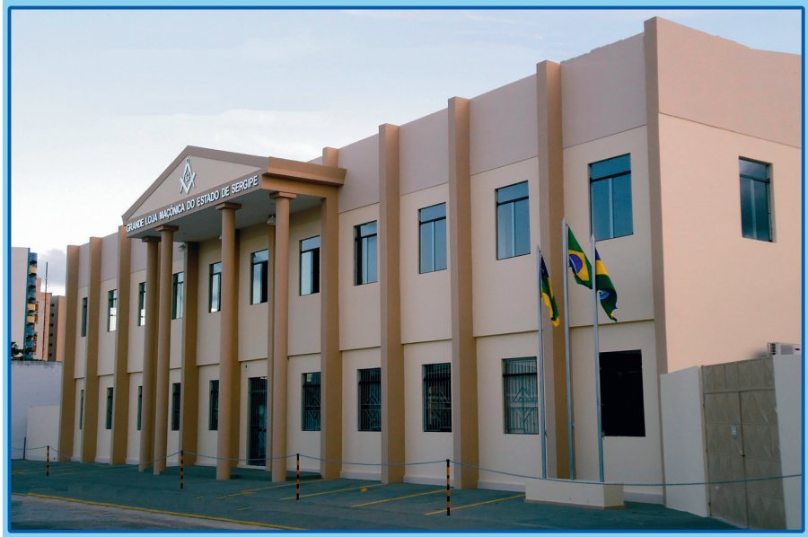
Grande Loja Maçônica do Estado de Sergipe