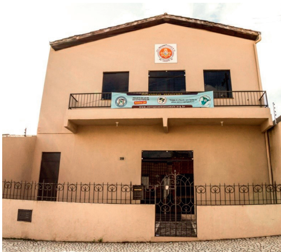
Sede Atual da Loja Luzes da Piedade

do Estado de Sergipe, além de trabalhar intensamente no desenvolvimento de ações paramaçônicas em favor das comunidades de Lagarto e adjacências com a efetiva participação dos irmãos, cunhadas e sobrinhos.